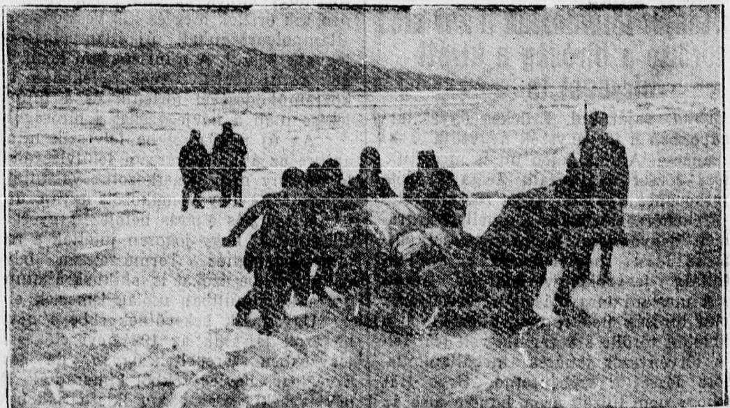
A Duna a szokotlanul nagy hidegben végig befagyott, Belgrádnál 60 cm. jégpáncél fedé. Ez a kép Belgrádnál készült a befagyott Duna jegén

szonyok keletkeznének. A tanár azt az erkölcsi jogcímet hozza nem tulságosan önzetlen tervének megvalósításához, hogy a golf-áram a mexikói öbölben keletkezik, tehát amerikai „magántulajdon”. A tervet részben gúnykacajjal, részben méltó felháborodással fogadta az európai sajtó, de általában nem tulajdonít neki nagyobb jelentőséget.