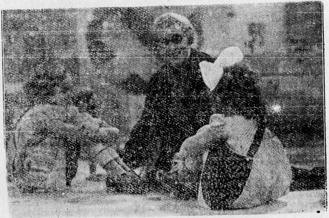
Käthe Dorsch, az Úfa „Anyai szeretet“ című új filmjének egyik jelenetében

Fagyasztott gesztenyepudding. 1½ kiló főtt gesztenyét szitán áttörünk, 1 liter tejjel, ½ rúd vaníliával és 20 deka cukorral felforraltunk, bekeverjük a gesztenyébe és könnyű pürét készítünk belőle. Hozzáadunk 10 deka apró kockára vágott cukrozott csümlécsőt és 6 deka mazsolát, melyet kevés cukorral felforraltunk, aztán megszagositjuk egy pohárka likőrrel és a fagyaltgép katalánában félig megfagyasztjuk. Ha nincs fagyaltgépünk, akkor egy dézsába apróra tört sós jeget teszünk (1 kiló jégre 20 deka só), beleássuk a habüstöt és folytonos forgatás közben félkeményre fagyasztjuk. Ha félig megfagyott, kivesszük és közibe keverünk fél liter tejszínhabot. Azután jól záródó puddingformába töltjük és beleássuk apró, jól megsózott jégbe. Egy óra múlva kivesszük a jégből, a formát hirtelen melegvízbe mártjuk és a tartalmát üveg-tálra borítjuk. Külön adunk hozzá hideg rumos mértaléket, mely így készül: 3 tojássárgát 4 deci tejjel, 15 deka perccukorral és egy pohárka rummal a habüstben gőz fölé addig keverünk, míg sűrűsödni kezd, aztán hidegre állítjuk. Felforraltni nem szabad, mert összefut.