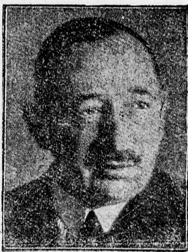
Bogdan Filoff professzor, Bulgária új miniszterelnöke

Csikezereda. Saját tud. A hagyományos „jég-törő Mátyás” Csikban is beváltotta a február 24-éhez fűzött reményeket: a déli órákban megkezdődött az olvadás. Azóta, bár a reggeli és éjszakai órákban még mindig 15–20 fok hideget mértek, fokozatosan enyhülés érezhető. Napközben 8–15 fok melege is lehet mérni napon. Időnkint gyenge déli szél is indul, melynek következtében megkezdődött az olvadás. Már most meglehetősen állapítani, hogy a szokatlanul erős és tartós hideg nagy károkat okozott. A legtöbb pincében megfagyott a burgonya és a zöldségféle. A gyümölcsfák is sokat szenvedtek és csak rügyfakadáskor lehet majd felmérni a kárt. A kemény fagy nagy kárt tett a városi aszfaltjárásban is.