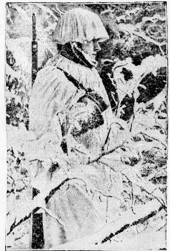
A nyugati fronton a német előőrsök fehér köpenyegesen teljesítenek szolgálatot, hogy az ellenség előtt láthatatlanok legyenek.

A tanfolyamokat délelőtt 9—11 óra között tartják meg a Katolikus Kör Regele Carol II. utca 2. szám alatt lévő nagytermében. Azok látogatása nemre való tekintet nélkül 7—60 évig kötelező mindazok számára akik nem esnek a légvédelmi törvény 6-ik és 7-ik szakaszának rendelkezései alá. Aki nek már van gázmaszkjuk, azok az előadásokon gázmaszkkal jelenjenek meg, hogy a gázkamrán is keresztül menjenek. Felkérjük a résztvevőket hogy a tanfolyamokon pontosan jelenjenek meg, mert a későn jövőket nem engedik be a terembe, hogy ne zavarják az előadás menetét. Minden résztvevő vigye magával az előadásokra igazolványát, a tájékoztató és a nyilvántartásba való beírás végett. Az ellenőrzés megkönnyítése végett mindenki tállie ki igazolványán a szükséges adatokat. Azok, akik nem látogatják az előadásokat, a légvédelmi törvény 63-ik paragrafusának c) pontja alapján 500—2000 lejig, vagy 1 naptól 1 hónapig terjedő büntetéssel sújtatnak.