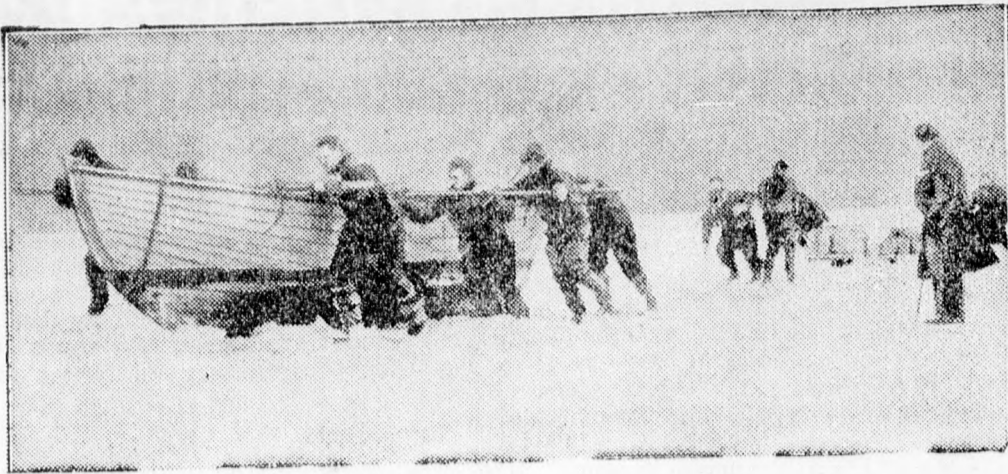
Évtizedek óta nem történt meg, hogy a Nagy Belt (Dániának Seeland és Fünen szigetek között levő öble) úgy befagyott volna, mint az idén, hogy — amint ez képünkön is látható — az áruszállítást kénytelenek szántalpakra szerelt csónakokon lebonyolítani