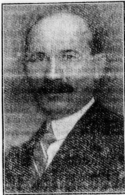
IONESCU-SISESTI. földművelésügyi miniszter.

— A földművelésügyi minisztérium gondoskodott vetőmagvak beszerzéséről is. A mezőgazdasági kamarák útján 560 vagon tavaszi búzát, zabot, árpat, burgonyát, napraforgót, len, kender és gyapot magot vásárolt. Ezeknek