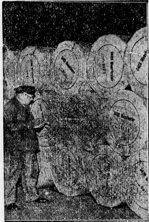
Ezen a képen egy rakomány ujságpapír látható, amit egy Manchesterbe induló angol hajón foglaltak le a németek és a hamburgi kikötőben raktároztak el.

Az olasz Stefani-ügynökség Helsinkiből való tudósítása közli, hogy Finnország gyászol ugyan,