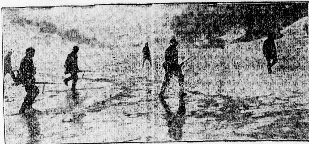
Német előőrsek a nyugati front egy hólepte szakaszán

— Gazdaságunk — mondotta a többi között, — harcol minden ostromzár ellen. Ellenfeleink ma azt remélik, hogy elfogynak bizonyos, a háború szempontjából fontos fémek, amelyek — ő úgy gondolják, — nem találhatók nálunk elég mennyiségben. Mi megadjuk erre is a választ és jólőre tartalékokat teremtünk ezekből a fémekből. Nagyszabású gyűjtőmozgalomra hívlak fel benneteket, bocsássátok a nemzetvédelem rendelkezésére minden nélkü-