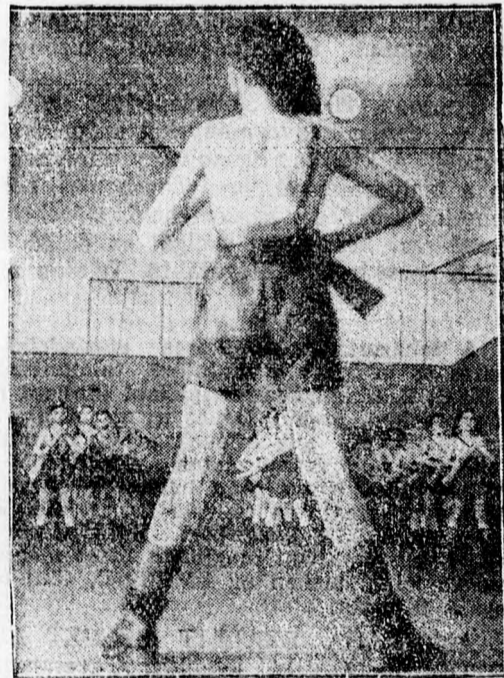
Olasz ballilák fegyvergyakorlatozás közben, egy iskola tornatermében.

Az erők egyenlőten megosztása tehát lehetlenné tesz minden direkt akciót s az IRA tudja ezt. Viszont angol hivatalos körököt változatlanul foglalkoztatja a kérdés: mire készül az IRA?