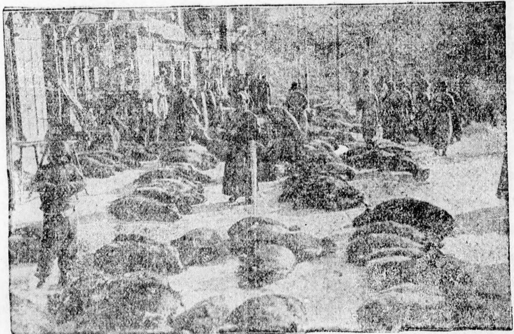
Ez az érdekes kép a pekingi sertespiacról készült, ahol az eladásra szánt elő ser-téseket a földre fektetve árusítják.

A vámhivatalok kötelesek a pénzügyminisztériummal tudatni, hogy melyik gyár hozott be B. vagy L. típusú nyers cellofánrostot, hogy azok feldolgozása ellenőrizhető legyen. Egyben megküldte a minisztérium azon gyárak jegyzékét, amelyek cellofánrost behozatalára engedélyt kaptak.