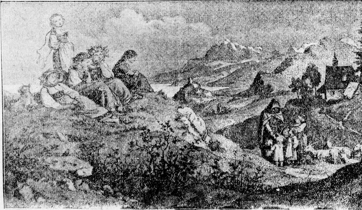
Tavaszi a hegyek között.

APOLLÓ: I. MÉGIS SZÉP AZ ÉLET. II. A MAGNÓT VONAL. DORIAN: AZ IGAZI ASSZONY.