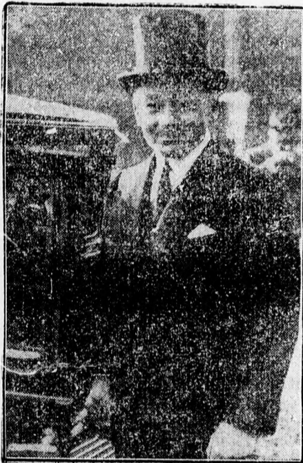
Reynaud, az új francia miniszterelnök és külügyminiszter, a minisztérium előtt gépkocsiba száll

Párizsból jelentik (Curentul): A francia külügyminisztérium közleményt adott ki. Eszerint az Illustration -ban közölt képen szereplő térkép, amelyről egyes külföldi lapok írtak, az európai határokat ábrázolja úgy, amilyenek