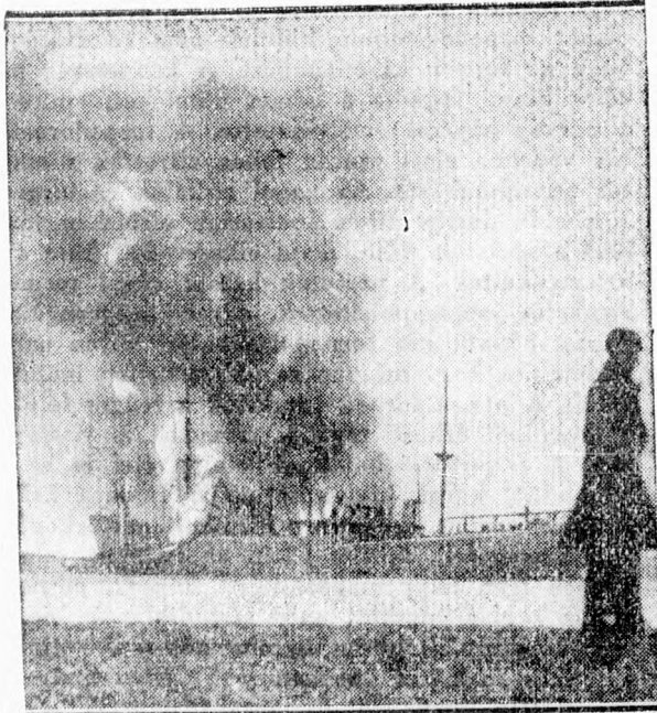
A „Barn Hill” nevű, felfegyverzett kereskedelmi hajót egy német repülőgép bombája felgyújtotta. Az égő hajót kitűzőbe vontatták, ahol teljesen elégett.

Párizsból jelentik: A Havas francia hírszolgálati iroda jelentése szerint csütörtök este 100 an-