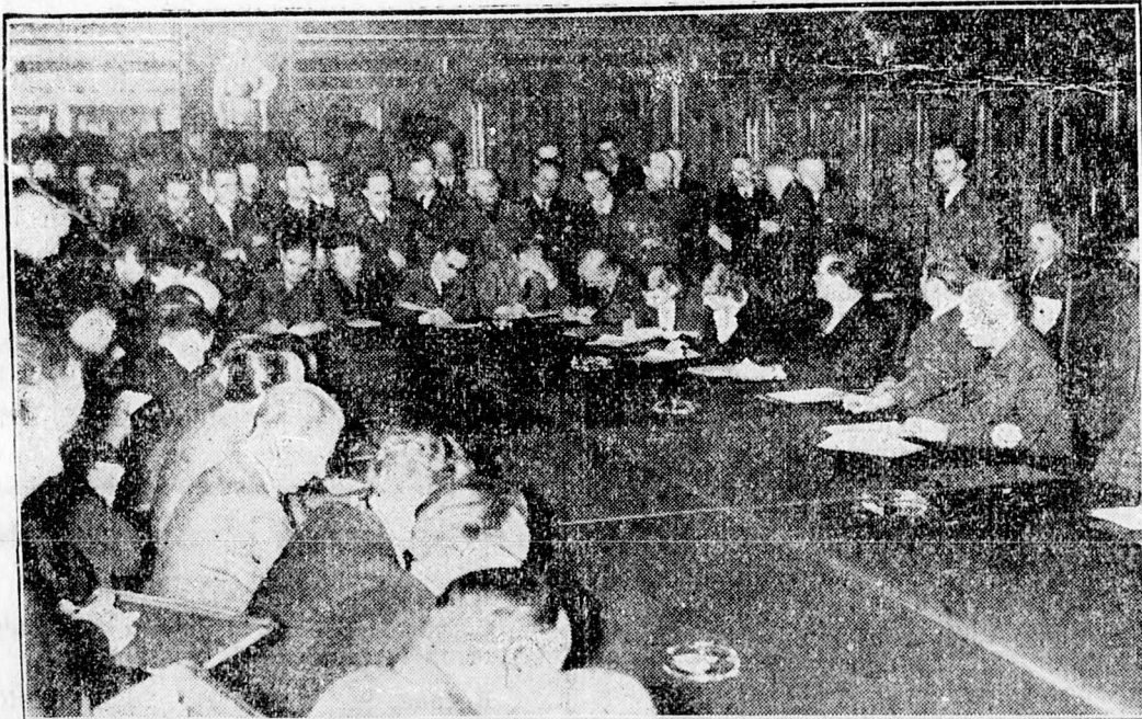
Ribbentropp német külügyminiszter nyilatkozatot adott a külföldi újságíróknak, a külügyminisztérium tanácstermében, a dán és norvég eseményekkel kapcsolatban. Ez a kép az újságírók egy csoportját ábrázolja, jobb oldalt látható Ribbentrop.

A Mercurea-ciuci Köztisztviselők és Nyugdíjasok Bankjának közgyűlése. Saját tud. 1927. évben Comaniciu tanfelügyelő és Constantin Ghiata megyefőnöki titkár kezdeményezésére megalakult a Csikmezei Köztisztviselők és Nyugdíjasok bankja. Célja, hogy a sürgős segítségre szoruló tagjai, minden nagyobb bankszerű formalitás nélkül, azonnal kölcsönhöz jussanak. Ezt a célkitűzést teljes egészében meg is váltotta. Ez időszerint 150 taggal rendelkezik és alaptőkéje meghaladja a 700 ezer leit. Az évi forgalma tul van a 15 millió. Ez a bank, a napokban tartotta meg évi rendes tisztújító közgyűlését. Elnök ismét Anton Mihalache, a törvényeséki végrehajtói hivatal főnöke lett, alelnök pedig Constantin Ghiata megyefőnöki titkár. Az igazgatóságba beavastották G. Olteanu ügyvédet, Csizsér Béla vármegyei főszámvevőt Titu Carsteanu rendőrfőnököt. A közgyűlésen elhatározták, hogy a megnehezült viszonyok miatt is, nagyarányú taggyűjtő akciót indítanak be, hogy az alaptőke gyarapításával még nagyobb mértékben megfelelhessenek vállalt feladataiknak.