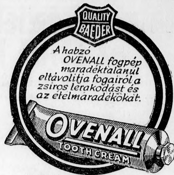
A HABZÓ FOGPÉP