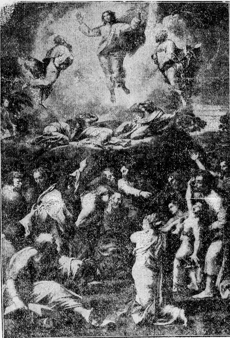
Raffaél világhírű festménye: Jézus mennybemenetele

Kelt Rómában, Szent Péter mellett 1940. április 15-én. Pápaságunk második évében.