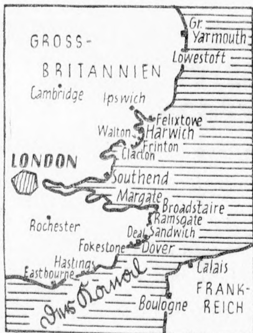
A La Manche-csatorna és a Temze terkeletének azzal kikötői.

Párizsból jelentik: Duff Cooper angol tájékoztató miniszter a párizsi rádióban beszédet mondott. Közölte, hogy a szövetségesek tájékoztató minisztériumai között a jövőben sokkal szorosabb lesz az együttműködés. A két ország szilárdan összetart és félelemre nincs ok. Az ilyen országokat