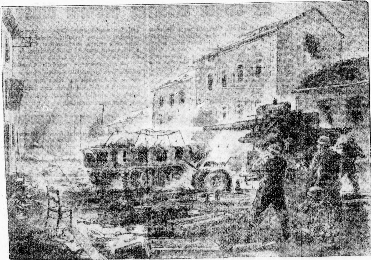
Megdöbbentő hatású rajz a dünkirchani utcai harcokról

Május 10-től június 3-ig Anglia, Franciaország és Belgium egyesített hadereje 1 millió 200 ezer embert veszített foglyokban halottakban