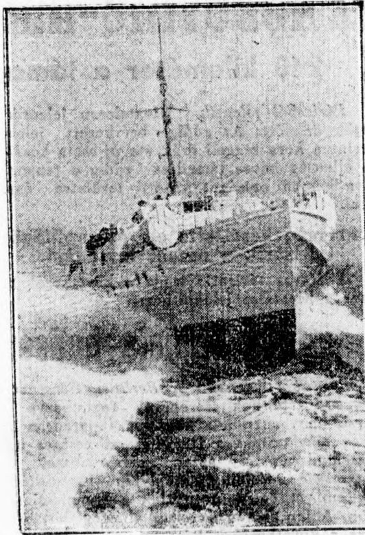
Karcsi gyorsnávad az Északi-tengeren.