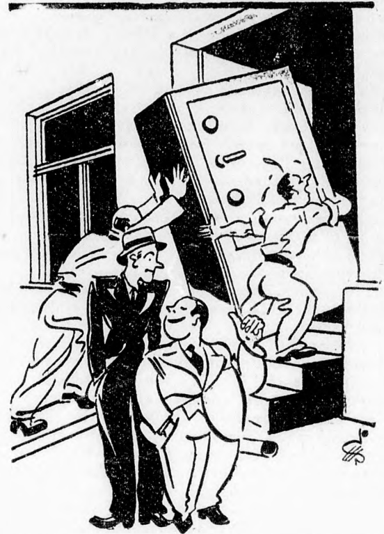
Már meg is vásároltam a pénzszekrényt, hogy legyen, hová tennem a milliókat, amelyeket holnap az Állami Sorsjáték huzásán nyerni fogok.