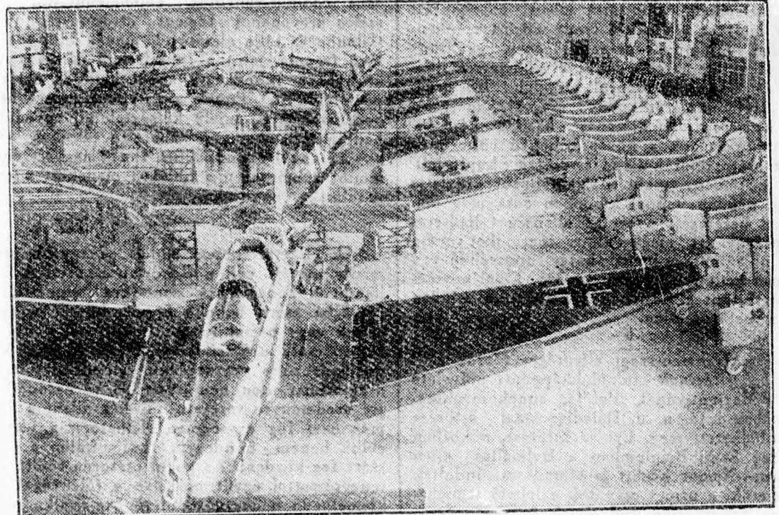
Készülő repülőgépek egy nagy repülőgépgyárban