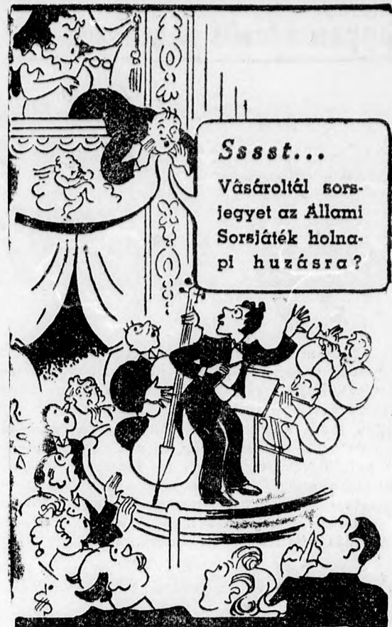
Az Állami Sorsjáték nyereményeit a játékosoknak minden adó levonása nélkül fizetik ki.

— A miniszterelnöki nyilatkozat meghallgatása után a szenátus hozzájárult a kormányhoz ahhoz az elhatározásához, hogy az angol-egyiptomi szerződés értelmében Angliának minden lehetséges támogatást megad.