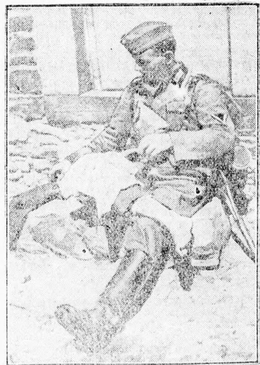
A meneteléshez nemcsak jó láb, hanem gondos előkészület is kell.