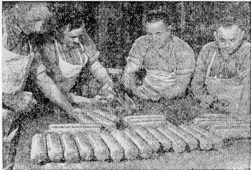
Készül a hadi szalámi a katonáknak.