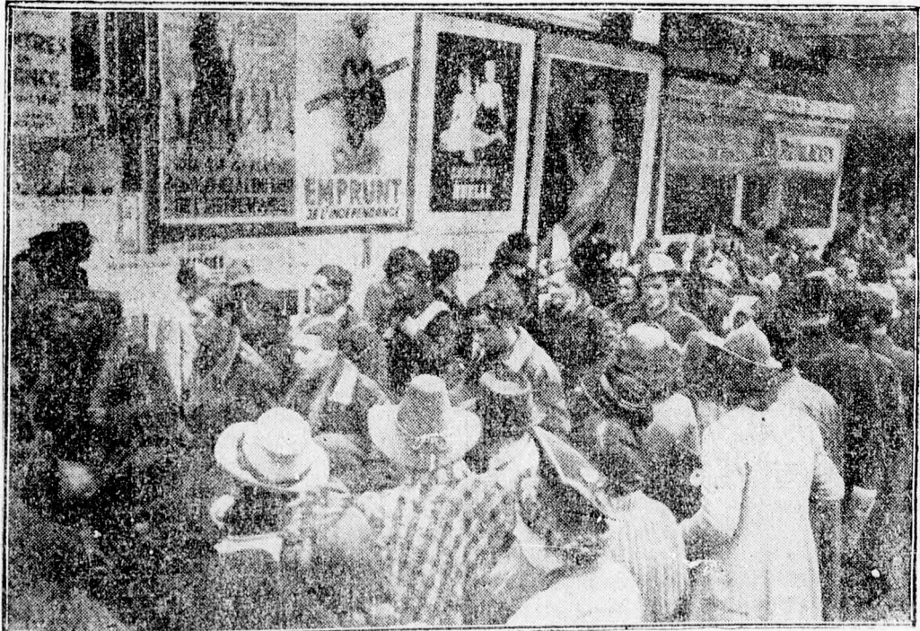
Fegyverszüneti — Hazatérnek a francia katonák