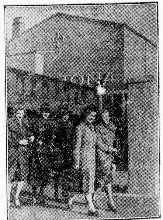
Az Ufa berlini telepének egyik épülete előtt készült ez a hangulatos felvétel. Kora reggel van, de a fiatal táncosnők már frissen és vidáman sietnek munkába.

Babelsbergben, a híres UFA-városban serényen folyik a munka. Az új tervek szerint a filmvárost minden tekintetben kiépítik és különösen említésre méltók azok a műszaki tökéletesítések, amelyek végrehajtanak. A német filmtermelés nem áll meg, sőt napról napra javul és tökéletesedik.