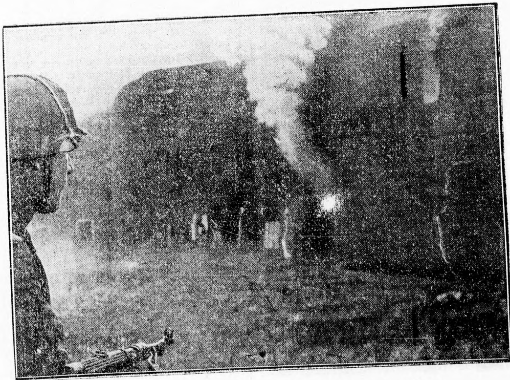
Érdekes kép az alszentesedett nyugati harctérről: felrobbantott erődítés

Öfelsége II. Károly király július 8-án délután 2 órakor bemutatkozó kihallgatáson fogadta a szokásos ceremóniák között Anatolio Lavrentiev -et, a Szovjetunió bucurestii követét.