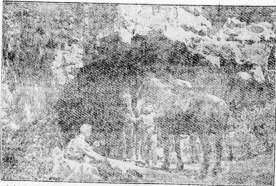
A francia hegyekben igen gyakori a barlangképződés. Egy ilyen barlangot is-tállónak rendeztek be a német katonák

A 60 százalékos kedvezményű jegyfüzeteket a külföldi utazási irodákban (MER-képviselet-nél) adják ki. A jegyfüzeteket az illető ország valutájában kell megfizetni.