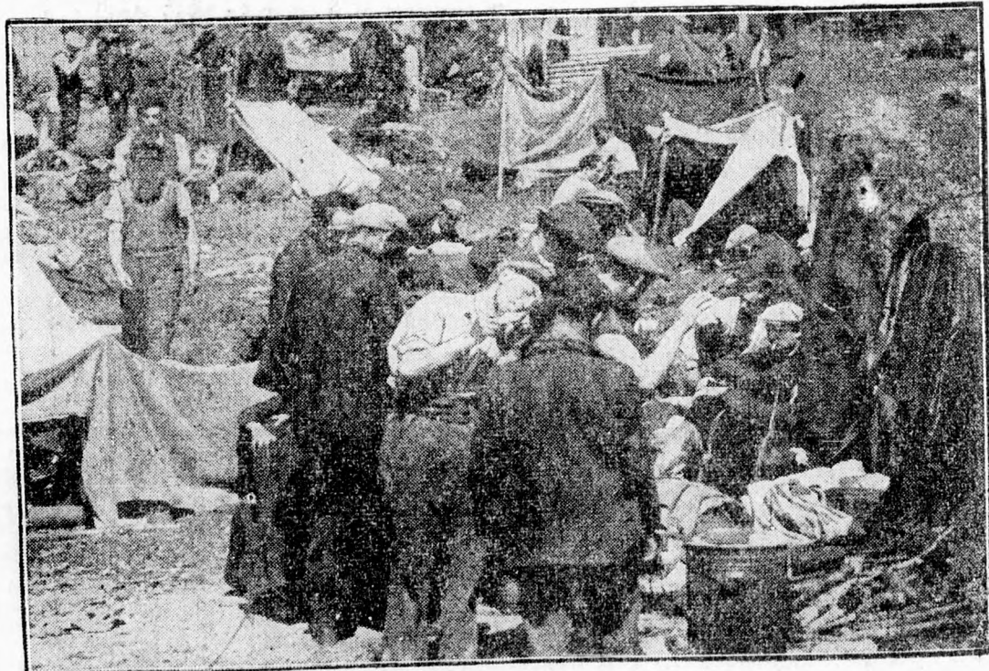
Hazatérésükre váró franciaországi menekültek tábora, reggeliosztás idején