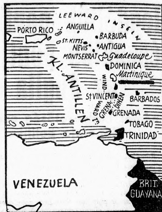
Martinique szigetét teljesen körülzárták az angol hadihajók

pecsétör később jelentést tesz a császárnak és indítványt tesz az új miniszterelnök személyét illetően. Japán politikai körök valószínűnek tartják, hogy a császár még a nap folyamán dönt a kormányválság megoldása tekintetében. A császárhoz és Kido főpecsétörhöz közellálló körökben Kido herceget tartják a legalkalmasabbnak a miniszterelnöki tisztségre.