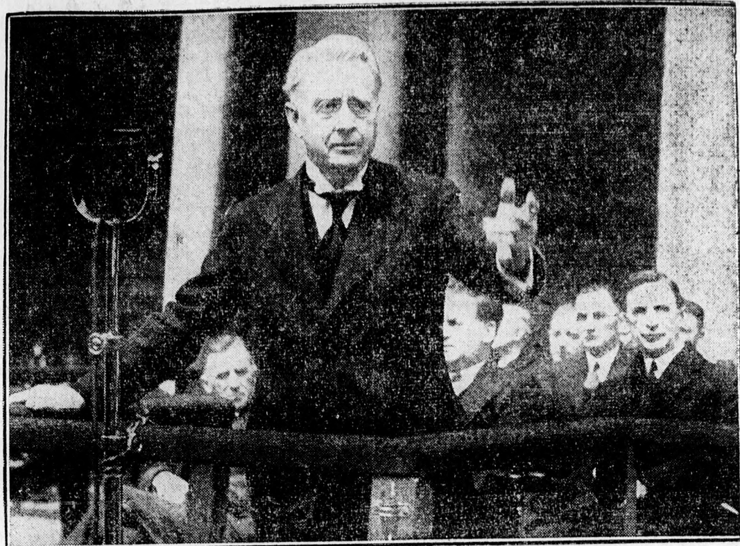
De Valera és Cosgrave, a két ir pártvezér 18 éve ellenfelei egymásnak, de most kibékültek a közösen folytatnak erőteljes agitációt Irország függetlensége érdekében. Ezen a képen Cosgrave látható, amint beszédet mond, a hátamögött jobbra De Valera áll