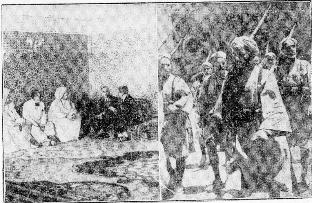
Első felvételek Tanager spanyol megszállásáról. Az első képen Asensió tábornok, a marokkói spanyol főkomisszár látható, a szultánnal, tangeri palotájában, a másik képen: a spanyol hadsereg marokkói csapatai bevonulnak Tangerbe