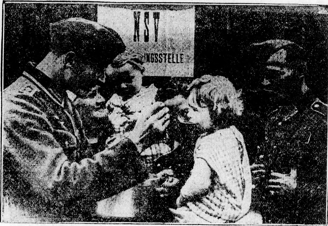
Német katonák a francia menekülteket ellátó segélyhelyen tevékeny részt vesznek az élelmiszer kiosztásánál. Egy jóléti katonai épp egy kis gyermeknek ad kávét