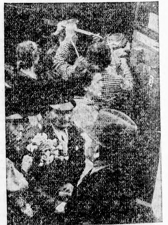
Repatriáltak hazatérésekor készült ez az érdekes kép a saarvidéken levő Merzig állomásán. Különösen a gyermekeket vették gondozásba

A kultuszminiszter indítványára az értekezlet résztvevői: hódoló táviratot küldtek őfelsége a királynak.