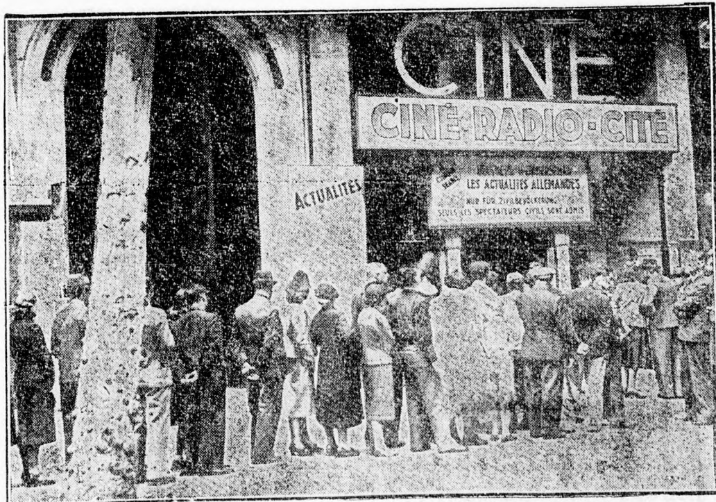
Párizsban igen nagy érdeklődéssel fogadják a német hiroadó filmeket. Egész tömegek várnak a mozik előtt, hogy bejuthassanak

A mult bölcs megfontolása kétségtelen tanulsággal szolgál arra, hogy az ilyen és hasonló eltévelyedések mily nagy veszélyt jelentettek nemcsak a kereszténység, hanem népek és nemzetek életében is. Tudjuk, hogy az újkor manicheusai, a szabadkőművesek is letűnnek egyszer, — de nem a mi küzdelmünk nélkül. Azért az általános európai leszámolás keretén belül a mi leszámolásunknak is meg kell történnie. (k. n.)