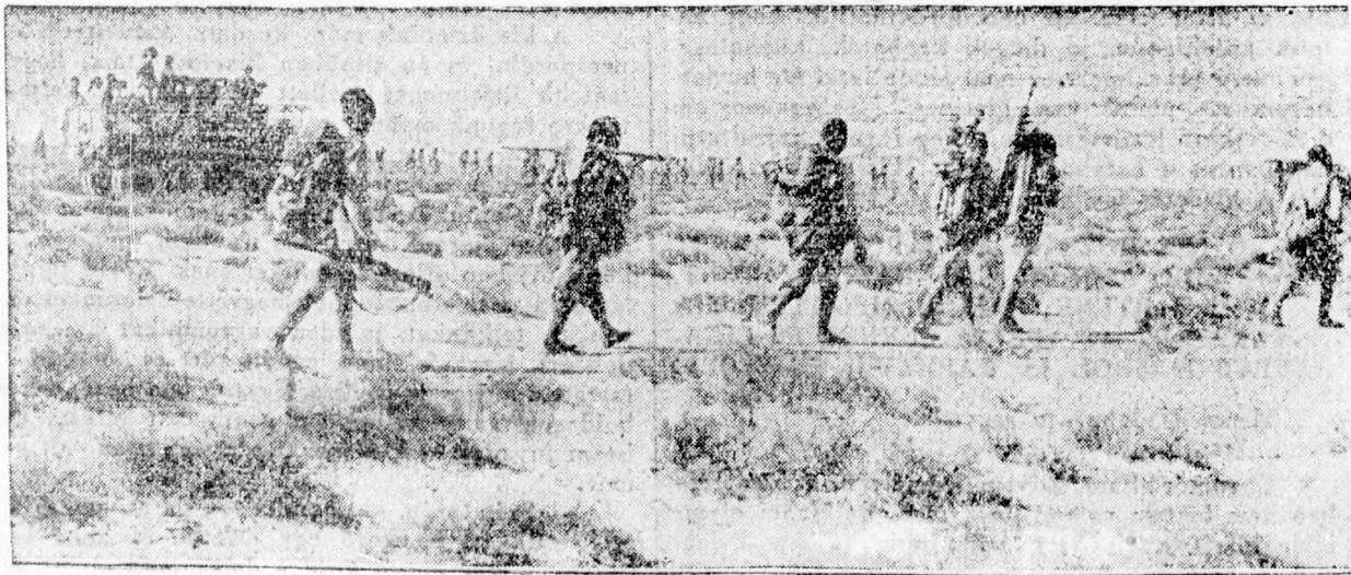
Olasz csapatok előnyomulása Libyában.

Rómából jelentik: A Stefani távirati ügynökség közli az olasz főhadiszállás 58-ik számú hivatalos jelentését: Málta szigete fölött végrehajtott támadó felderítő repülés során egyik repülőgépünk lelőtt egy angol gépet. Összesített gépeink visszatertek támaszpontjaikra. Északafrikában a kirendelt határon túl harcok voltak az ellenséges elemekkel. Az ellenséget megfutamtítottuk két harci-