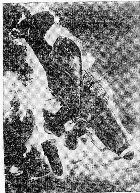
A Stuka lecsap áldozatára.

Sollum katonai parancsnokságának épületén. Az angolok fejvesztetten menekültek Marsa Matruh irányába és tíz óra negyvenkor az összes épületet előtt olasz őrség állott.