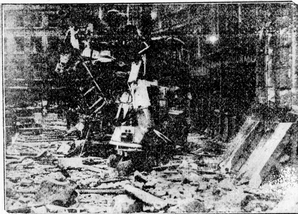
Londoni utca — német légi bombatámadás után.

Eredményesen folynak a tárgyalások a Moskovits és „Vego” gyárakkal. Nagyvárad. Saj. tud. Mint értesülünk, a munkabérek rendezése kapcsán a Nemzeti Munkaközpont tárgyalásokat folytat a Moskovits vegyipar és Vego cipőgyár munkásai bérjavításának tárgyában. A tárgyalások eddigi menete mindkét részről kielégítő eredménnyel halad.