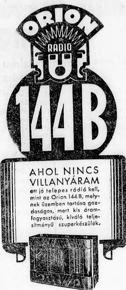
Minden Orion rádiókereskedőnél kapható

Ez természetesen a közösségi érdekek helyes ismeretét, az abba való helyezkedés becsületes akarását és feltétlen fegyelmezettséget követel. E három kellék nélkül az egyén boldogtalanná válik, a nemzeti vagy állami közösség pedig végszesen érezni fogja az arra való emberek hiányát. Márpedig az ember örök és legáltaláno-