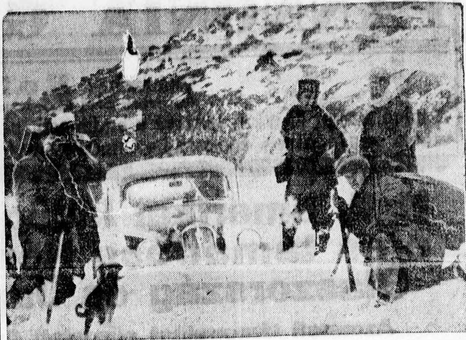
A svájci hegyekben megrekedt egy lúraautó a nagy hóban.