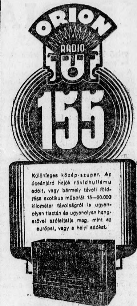
Minden Orion rádiókereskedésnél kapható.

Pénteken az esti órákban meghalt Pártos Lászlóné, akit mint tegnapi