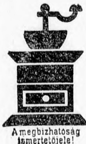
A megbízhatóság társjelvénye!

Pompás szín, kiváló zamat, étvágygerjesztő illat, tökéletes finom íz: