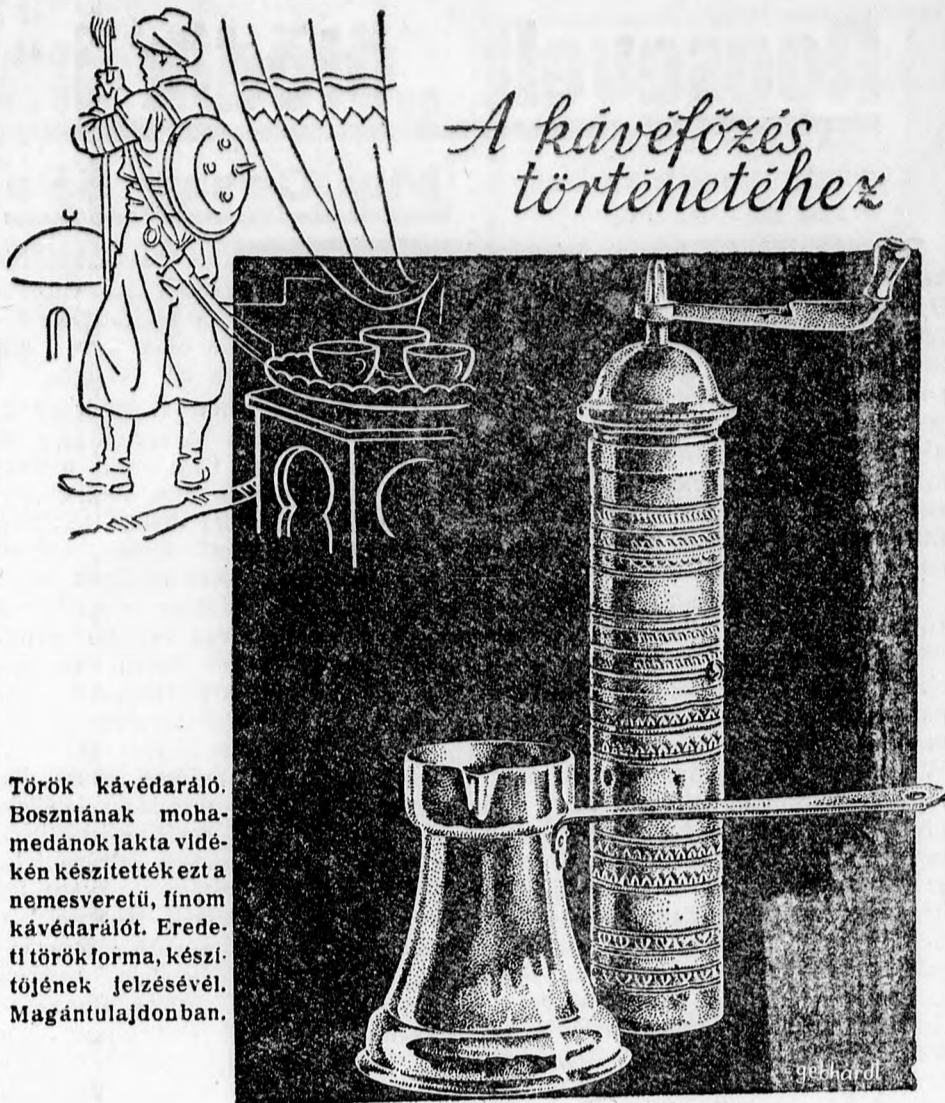
Török kávédaráló. Bosznának mohamedánok lakta vidékén készítették ezt a nemesveretű, finom kávédarálót. Eredeti törökforma, készítőjének jelzésével. Magántulajdonban.

vas, fés ték és háztartási cikkek kereskedésben. Rákóczi-ut 2. — Bazár épület.