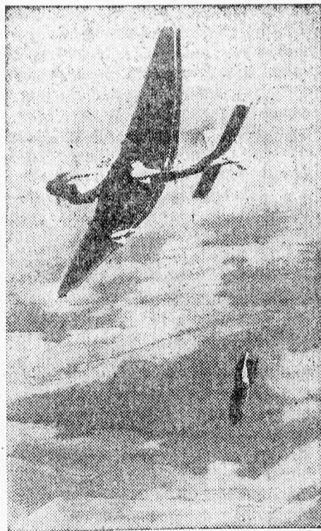
Német bombavető repülőgép London felett

Tangerből jelenti a Stefani: A szicíliai csatornában lefolyt légi és tengeri csatában megsérült angol hajók kénytelenek voltak Gibraltárba menekülni, hogy kijavítsák a rajtuk esett sérüléseket. Mint Gibraltárból jelentik, a hajókon szolgáló tengerészek elbeszélések, hogy ya brit egységek ellen intézett tengeri és légi támadások hihetlenül hevesek és merészek voltak és teljesen felfordították az angol tengerészeti parancsnokság terveit. A tengerészek elbeszélése szerint az angol hadvezetőség tervével kettős célt akart elérni, az angol hajóhadnak Szicília és Túnis között szándékolt összpontosítását, megvédeni a Földközi-tengeren lebonyolítandó forgalmat, északafrikai és görögországi angol csapatok utánpótlása céljából. Ugyanakkor megakadályozni, hogy Líbiába olasz erősítések érkezzenek.