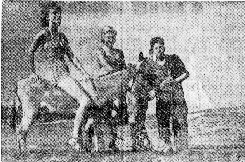
Megy a kislány számaron, földig ér a lába