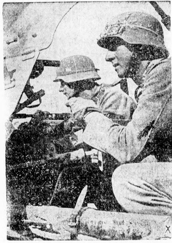
Német páncéltörő munkában.