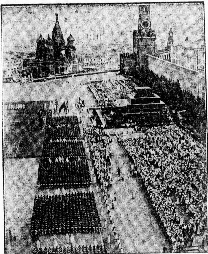
Diszfelvonulás a moszkvai Kreml főterén, a „Vörös-téren” Lenin mauzoleuma előtt. Ma már az egész Kreml romokban hever a „vörös próféta” siremlékével együtt.

kezdett betörésüket a Kievtől délre eső térségben lévő megerősített szovjet állások ellen. A német csapatok merész rohammal kivelelték a szovjet csapatokat földállásaikból és bevették 21 kiserődöt. A szovjet ellen-támadások a németek hatásos tüze-