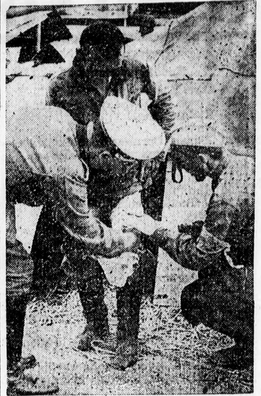
Igy ápolják a németek a sebesült szovjet katonákat.

Zürichből jelentik: Moszkvai jelentés szerint az északi frontszakaszon hatalmas offenzíva alakult ki. Vorosilov tábornok csapatainak helyzete kritikus. A Ladoga-tó felé nyugatra az orosz katonák hulláinak ezrei hevernek szanaszét. A német páncélosok előnyomulását most már nem lehet feltartóztatni. (MTI.)