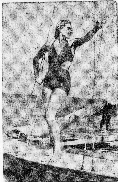
...Hullámzó Balaton tetején...

— Hajdan százhuszor is sikerült, — mentegetőzött a Béli stás rendőr- kapitány a nyuglónál, amikor csak