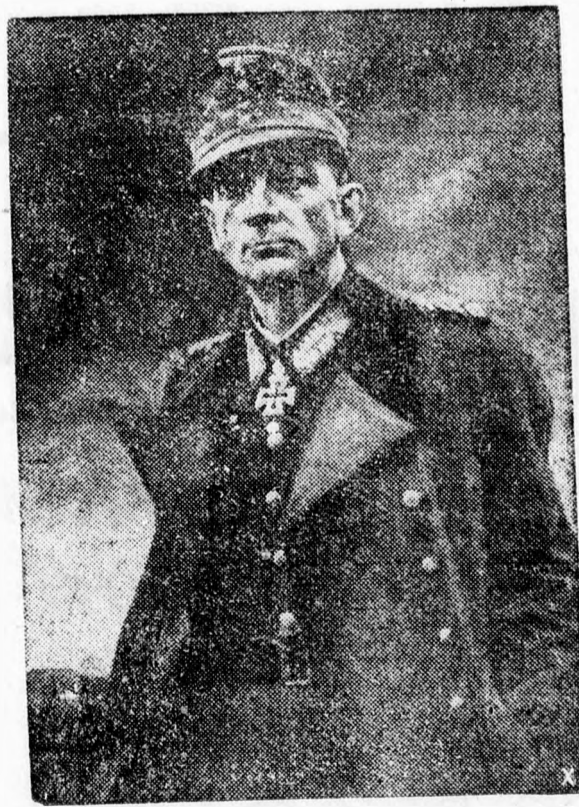
Dietl tábornagy Norvégia legendás hőse a keleti fronton is bűntette magát

A fogalmi meghatározásokat ilyen módon minden kétséget kizáróan tisztázó és kijátszásokat drákói szigorral büntető rendelkezésekkel végre meg lehetne oldani a kulcspozíciók eddig még mindig rendezetlen és már régóta kínosan vajudó problémáját és ezzel együtt a kérdést az egész magyar keresztény gazdasági közvélemény kívánságának megfelelően nyugvóponttra lehetne hozni.