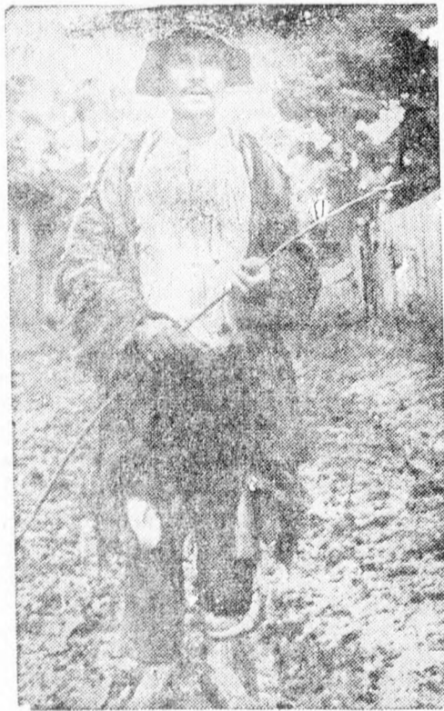
Igy test egy „boldog” elvtárs

Mivel pedig a rádiósugárzás szempontjából Erdély hegyes terepe renki-vül előnytelen, ezen tilmenően valószínűleg sor fog kerüdni a vétellehetőségek megjavítása céljából a székegy medencében egy rádióközvetítő állomás felállítására is.