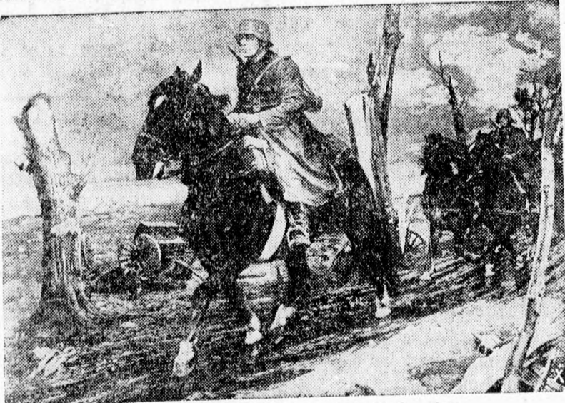
Hajnali lovasjárőr a keleti fronton

Berlinből jelenti a Német TI: Az angol légierő veresége 9-én a megszállt területek felett történt berepülési kísérletek során 19 gépre emelkedett. (MTI)