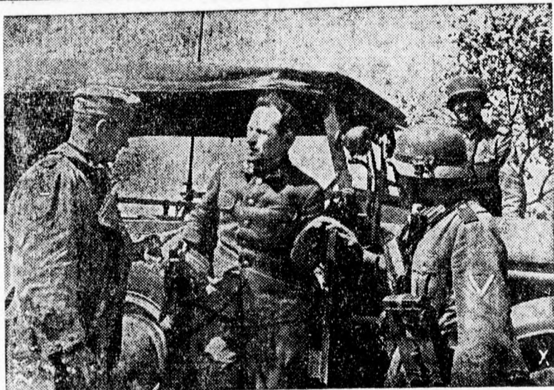
Kihallgatják a németek a fogoly szovjet tábornokot

Berlinből jelentik: (NTI) A keleti arcvonal északi részén a németek megsemmisítették 75 szovjet páncélost, köztük hét igen nehéz páncélost. A keleti arcvonal déli részének egyik szakaszán ugyanezen a napon hét szovjet