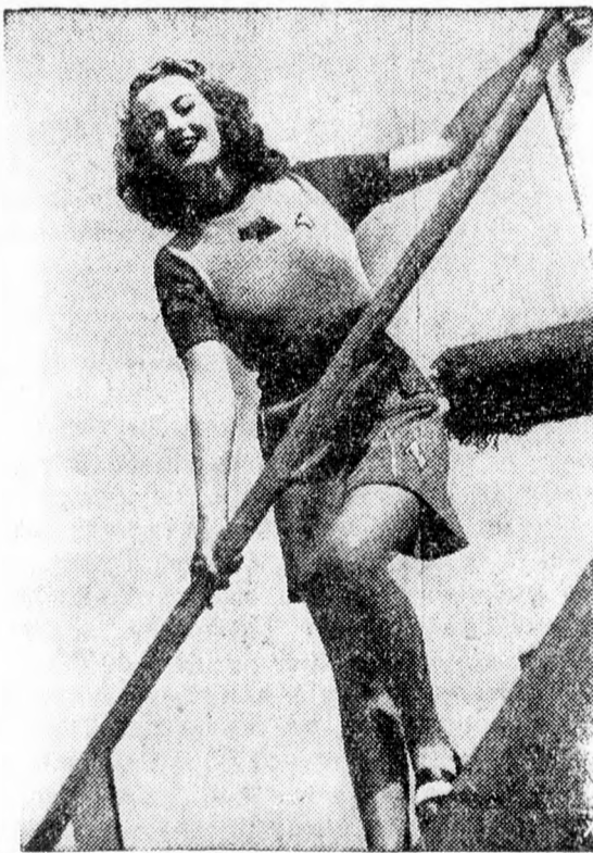
De jó is a friss levegőn nyári napsütésben!