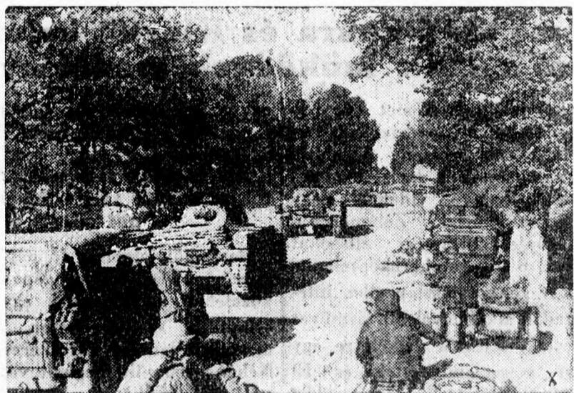
Példás rendben és tervszerűséggel folyik az előnyomulás Oroszországban

Az ujonnan felállított kolozsvári m. kir. Vetőmagvizsgáló Intézet úgy irás- ban, mint szóban, a legnagyobb készsé- ggel áll a működési területen élő gazdák rendelkezésére és kéri, hogy vetőmagvizsgálati ügyekben teljes bi- zalommal forduljanak hozzá. (R. J.)