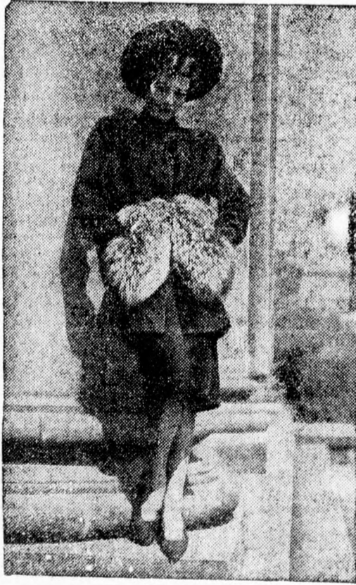
3. Fekete gyapjuszövet komplé platina-róka-zsebekkel