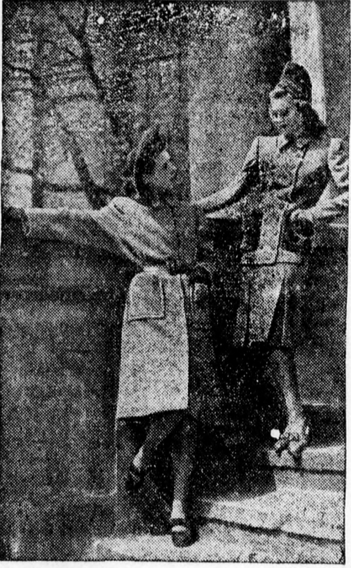
1. Raglánszabású, magasan záródó gyapjuszövet kabát rávarrot, zsebekkel és kétsoros gombolású kosztüm, nutria-zsebekkel

Bécs, szeptember hó Tavaszi volt és hideg, a nap alig alig dugta még ki fejét a felhők kö- zül, amikor utoljára álltunk a törté- nelmi Lobkowitz-palota barokk termei-