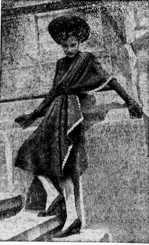
2. Sötétbarna selyemből készült elegáns délutáni ruha, ujszerű szabással. A szegélyezése aranyhímzés.

Nagyot változott azonban a kabátdivat. A bő, raglánszerű, igen praktikus és szép formák helyébe a merőlegesen aláhulló egyenes vonal lépett. Jó alak mellett roppant elegáns és feltűnően decens megoldás. A bluzszerűen kidudorodó hát egészen eltűnt, egyetlen egyet sem láttunk. Sima tehát a hátvonal és disznélküli a kabát eleje is. A még tavalyról, sőt az idei tavaszról is ismeretes felrakott nagy külső zsebek részben eltűntek és többnyire egy-egy keskeny, részletes vágás jelzi csak a zseb helyét, jól eldugva a kabát oldalán. A sok esztendő uralkodó sportdivat egykor már jelentkezett „ceruzasilhouette” felújításához, de legalább is közeledéséhez mutat ez a favorizált új vonal. Igen sok esetben megfigyeltük, hogy egészen a külső baloldalon gomboló-