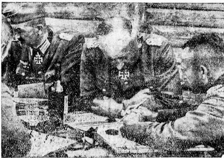
Igy dolgozik egy német vezérkar

A bolsevikiek menekülésszerűen irtették ki állásaikat. A szovjetcsapatok hátrahagyták lövegeiket, továbbá