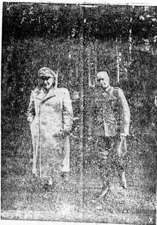
Német vezérkari tisztek az orosz fronton