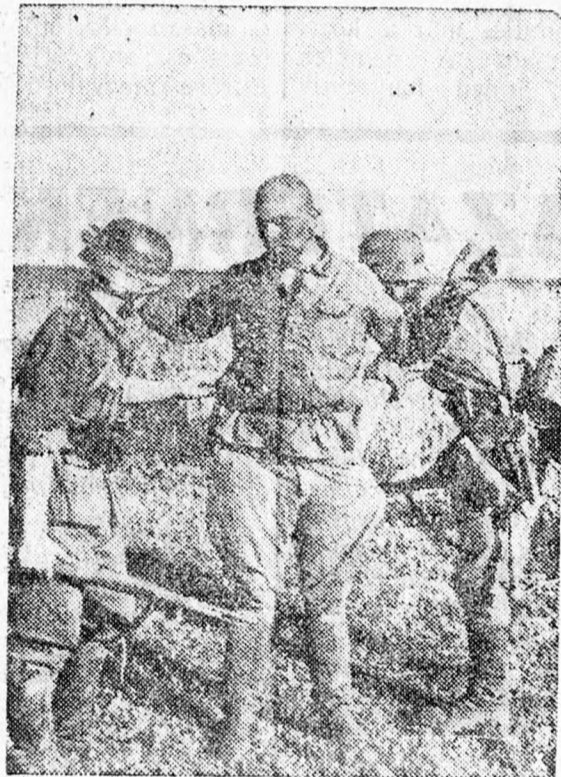
Német katonák megróhamoznak egy orosz foglyot