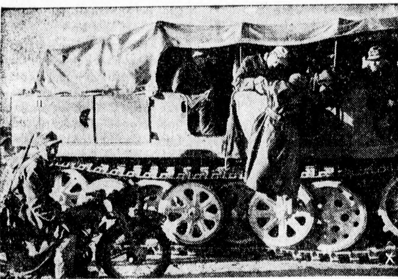
Riadó! Előre az ellenség nyomában