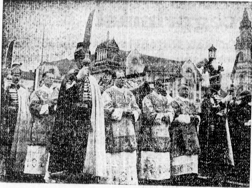
Megérkezik a Szent Jobb a Szent László-térre

századain keresztül sokszor megtörtént, hogy megcsönkítették a hazát, de a magyar primás hatáskörét soha megcsönkítani nem lehetett és a magyar primás az ő személyével és hatalmával mindig az egész Magyarországot képviselte. Amikor most, mint az egész ország primása eljöhettek Szent László városába, mélyeséges tisztelettel, katolikus és magyar szeretettel köszöntöm ennek a városnak és az egész megye közönségét és szívből köszönöm azokat az üdvözlő szavakat, amelyeket a Szent Jobbhoz és a Szent Jobb előtt az én csekélységemhez intézni szívesek voltak. Azokért a beszédért, a kedves fogadtatásért és falként azokért a meleg érzelmekért, amelyeket megjelenésem első pillanatától fogva tapasztaltam fogadják ez a város és az egész megye mélyeséges és hálás köszönetemet és azt kívánom, hogy Szent István király Jobbjá és az Uristen áldása telegyen e város felett és kísérelje ennek a városnak és megyének egész életét.