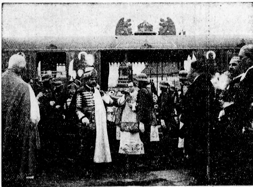
Az aranyvonat érkezése

Megható pillanat. A szemekben könny csillog, amikor első szent királyunk csodálatosan épségben maradt jobb kezét megpillantjuk.