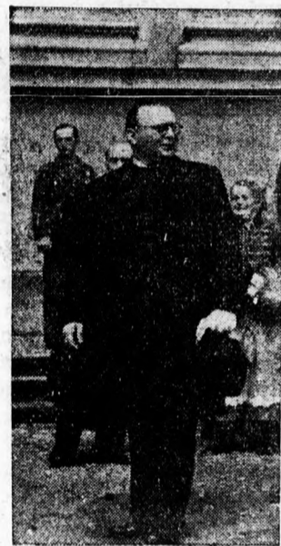
Dr. ANTAL ISTVÁN propagandaügyi miniszter Nagyváradon