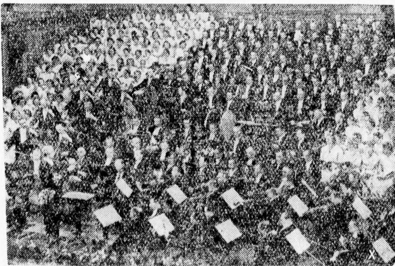
Zurwängler, a világhírű német karmester a berlini filharmonikusokat vezé nyli