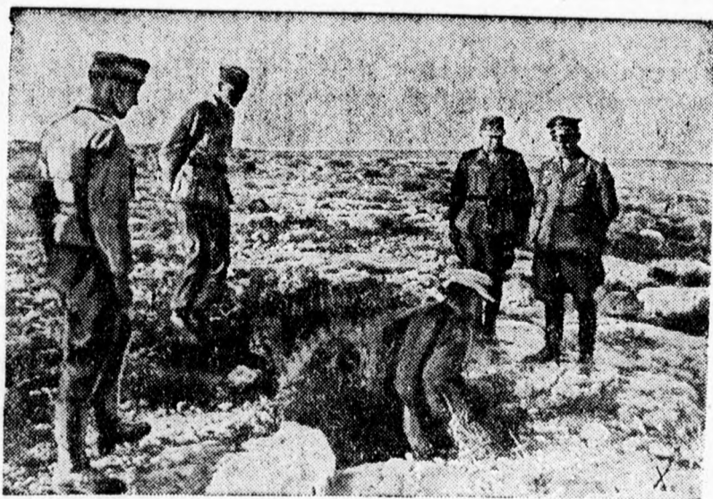
Rommel vezértábornagy egy tüzérségi megfigyelő állás előtt

Szófiából jelentik: (MTI.) A Német Távirati Iroda jelenti: Hétfőn délután tartotta a bolgár képviselőház negyedik rendkívüli ülészakánának megnyitását. Filov miniszterelnök közölte a képviselőházzal, hogy a kormány beajánlotta lemondását. A király újból Filovot bízta meg kormányalakítással. Filov miniszterelnök már bejelentette a kormányának tagjait.