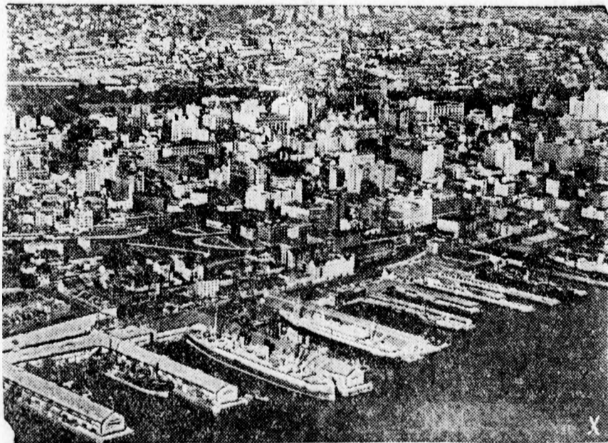
Sidney kikötője, ahol a japánok elsüllyesztettek egy csatahajót

(Berlin.) (MTI.) A Führer főhadiszállásáról jelentik a NTI-nek. A véderő főparancsnoksága közli: A Szebasztopol ellen folyó támadás során német hadosztályok észak felől betörték a belső erődjébe. A szovjet ellenállások hatástalanok maradtak. A keletről induló támadásban román kötelékekkel együttműködve, elfoglaltuk az uralkodó fontosságú Sapur magaslatot. Kercsnél egy 18 hajóból álló ellenséges hajóköteléknek a szoroson át megkísérelt előretörését eredményes tüzérségi tüzzel meghiúsítottuk. A Donec medencében az ellenség helyi támadásai, az ellenség nagy veszteségei mellett omlottak össze. A volchovi katonai területén folyó tisztogató hadműveletek során több szétszórt ellenséges erőcsoportot semmisítettünk meg és további 1100 foglyot ejtettünk. E harcok során 21 ellenséges páncélost megsemmisítettünk és több üteget harcképtelenné tettünk. A Finn tengeröbölben harczi gépeink elsüllyesz-