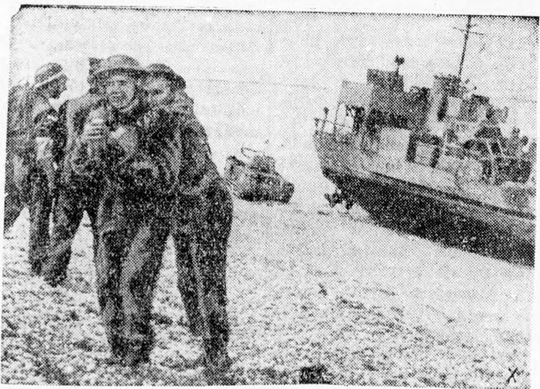
Igy „szálltak partra” az angolok Diepenél

bombákkal találatokat értek el Anglia déli partjainál egy csapatában. A mára virradó éjjel Midland és Északkelet-Anglia hadifontosságú berendezéseit bombázta légi erők. Sok tüzet okoztunk.