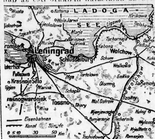
A keleti front északi szakasza

Magányosan szálló angol gépek tegnap az esti órákban hatástalan zavaró