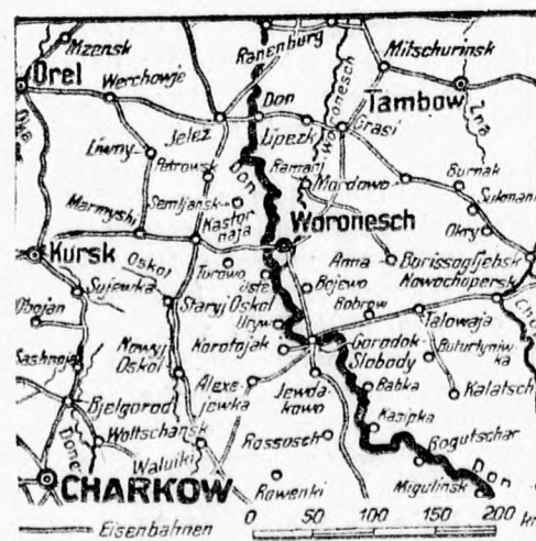
A keleti front középső szakasza

Német és szövetséges csapatok a légierőtől támogatva a Volga és a Don között visszaverték a szovjet erőket és a nagy Don-kanyarulatban részben ellentámadásokkal hiúsították meg az ismételt ellenséges támadásokat. 30 szovjet páncélcocsit megsemmisítettek. A doni arcvonalon az olasz csapatok szakaszán a szovjet nagy gyalogsági és páncélos erőkkel folytatta támadásait. A német hadsereg