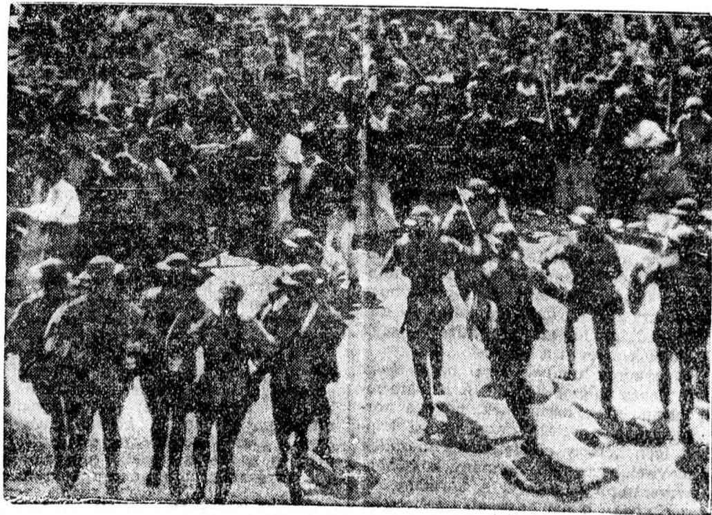
A jeruzsálemi zavarítások színhelyéről.

olasz Brenneren nyugszik. És az új császár zászlója büszkén és biztosan, erősen és mozdulatlanul tekint le innen Tiroira. J. A.