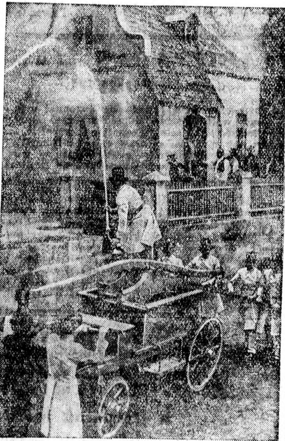
1850-ben a bécsi tűzoltók cilinderben és kézfecskendővel dolgoztak.

Fontos rendelet a falusi malmokról. Az új fogyasztási törvény értelmében a falusi malmok és olajprens malmok, amelyek a taxa firfitárát fizetik, kötelesek a pénzügyigazgatósághoz egy beadványt intézni, amely a következő pontokat tartalmazza: 1. A huszonnégy órai termelés mennyiségét (buzában, rozshan és olajban). 2. Az utolsó három év középátlama mennyiségét (buzában, rozshan és olajban). 3. Hány napot dolgozott az utolsó három évben és ezt évenként külön-külön kimutatva. Tekintettel arra, hogy a miniszter rendeletének igen fontos célja van, figyelmeztetjük az érdekelt malomtulajdonosokat, hogy a fenti kimutatást még ebben a hónapban adják be a pénzügyigazgatóság szeszügyosztályához.