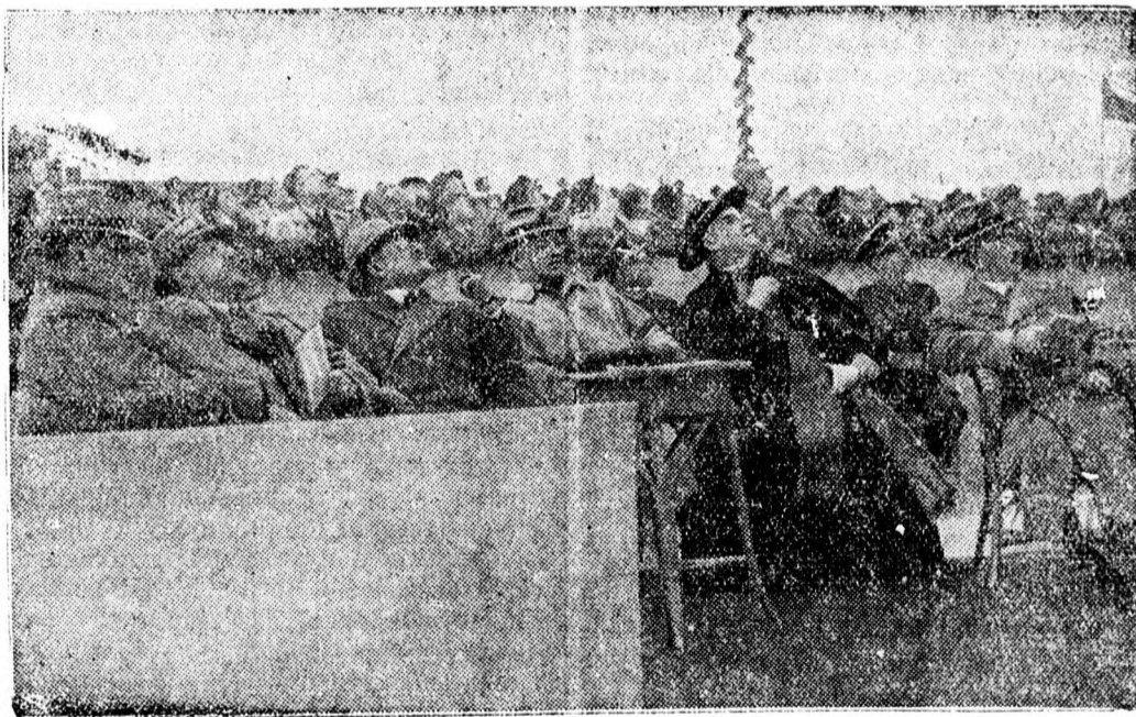
Megkezdődött Prágában Csehszlovákia légi haderejének nagy-gyakorlata.