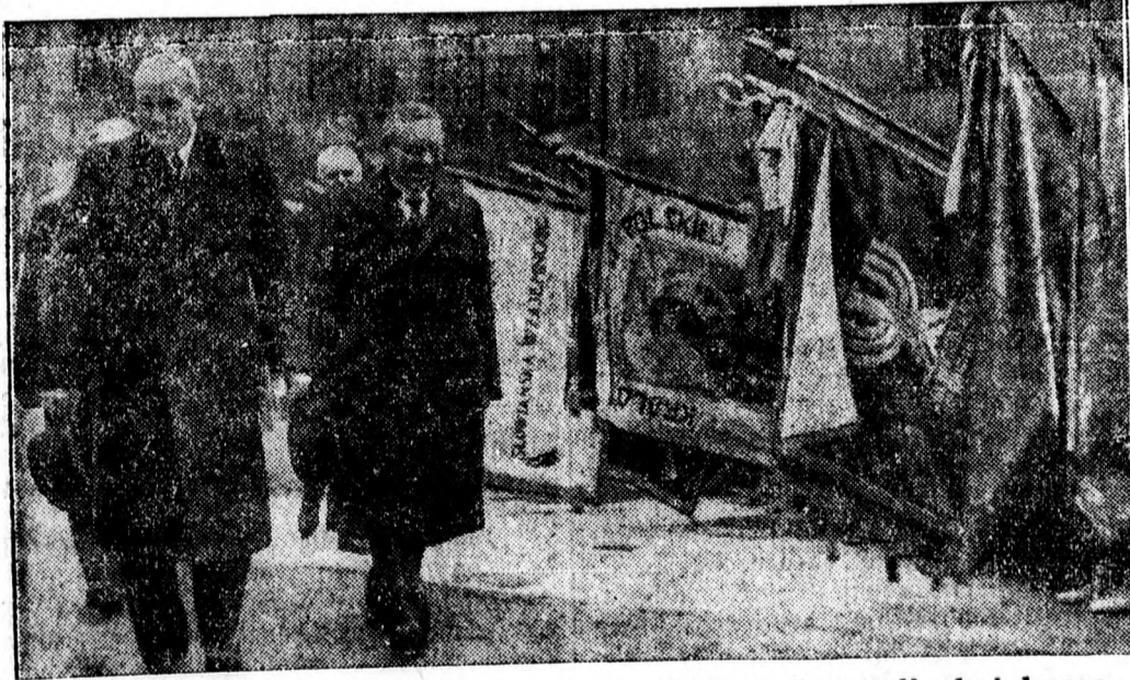
A lengyel ifjuság Moscicki köztársasági elnököt ünnepeli hatalomra-jutása tizedik esztendejében. Varsóban a különféle ifjusági egyesületek zászlók alatt jelentek meg, hogy szerencsikívánataikat kifejezhessék az elnöknek.

Van Zeeland miniszterelnök szerdán fogadta a munkások és munkaadók küldöttségét, de megállapodást nem sikerült létrehozni.