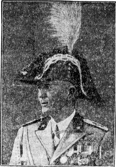
Badoglio marsall, Addisz-Abeba hercege.

Jeruzsálemből jelentik: A haifai városháza ellen bombamerénylet követtek el. Az épület erősen megrongálódott. Jaffa közelében az arabok megtámadták a rendőrszemét. Tűzharc keletkezett. Végül is a rendőröknek sikerült visszaverniök a támadókat, akik több halott hátrahagyásával elmenekültek.