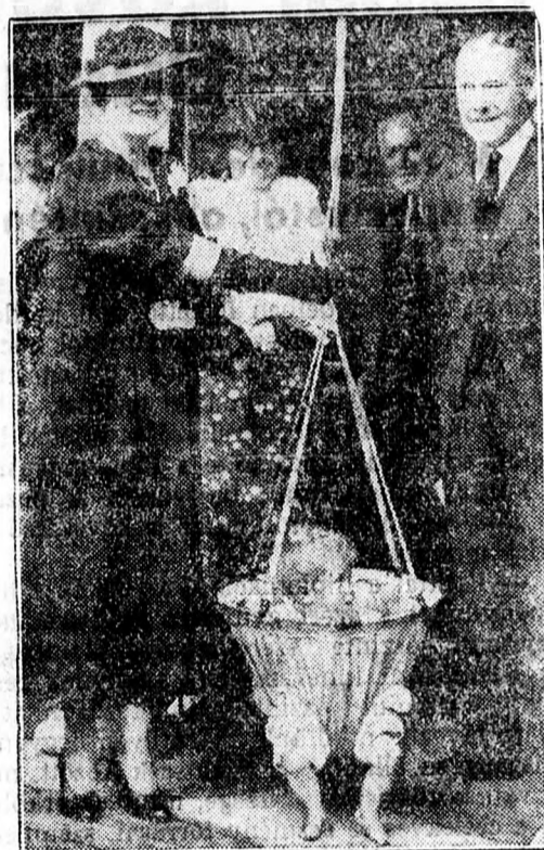
A vorki hercegnő a cheilly-i gyermekotthon felavatásán kipróbálja egy „futókosár” célszerűségét.

A súlyos visszaélés ügyében az oradeai rendőrség bünyügyi osztálya is bevezette a nyomozást, miután felmerült az a gyanu, hogy a közokirat-hamisítók ott is vannak bűntársai.