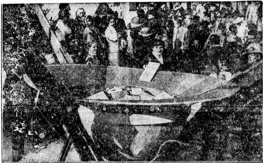
A római óriás tropusi sisak.

Rómában a könyvvásár napján a képünkön látható óriási sisakot állították fel a piactéren, hogy mindenki beledobhasson az Abessziniában letelepedő olasz katonák részére egy-két könyvet. A könyv-gyűjtésnek ez az érdekkes módja nem maradt eredménytelen, mert az óriási sisak rövid idő alatt megtelt és a nap folyamán több ízben is ki kellett üríteni.