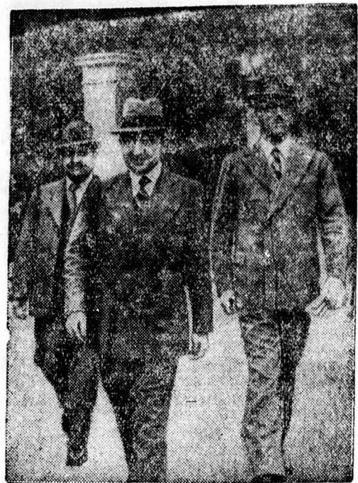
Delbos Iván francia külügyminiszter (jobbról) Massigli francia kiküldött társaságában Genfben. Képünk a népszövetségi palota előtt ábrázolja a két francia politikus.