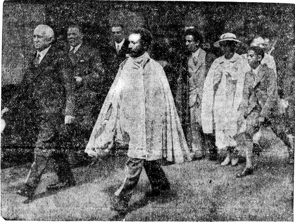
A négyest néhány lépésnyi távolságban kísérte családja, mikor a genfi tárgyalásokra indult.