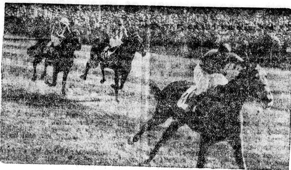
A „Nereide” kilencedik győzelme ezidén.

A rendőrség természetesen nem tudja, hogy kik voltak az autós banditák, akik ilyen merészen gyilkoltak teljes világhíresség mellett a város szívében, nyílt utcán.