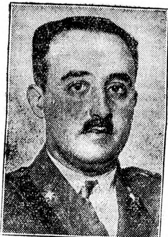
Franko tábornok, a spanyol felkelők vezére.

(Madrid.) A kormány háborús vésztanácsot alakított, mely élet és halál ura az öt keleti tartományban. Elnöke Barrio baloldali poli-