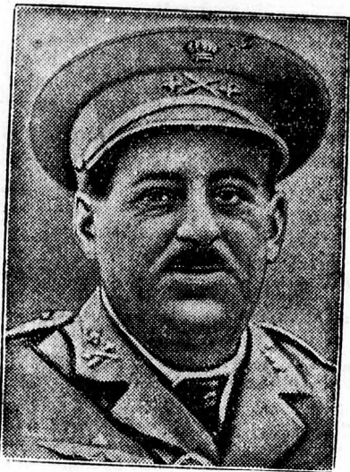
Sanjurjo tábornok, Abd el Krim legyőzője repülőszerecséltenség áldozatául esett.

Londonból jelentik: A Daily Express szenzációt keltő jelentést közöl, mely szerint a barcelonai kikötőbe érkezett a Montecuccoli nevű olasz hadihajó és bombázni akarta Barcelonát, mert a kommunisták felgyújtották a fasiszta székházat. Mac-Horton angol tengernagy, a London nevű angol cirkáló parancsnoka észrevette, hogy a Montecuccoli kikötő felé irányította ütegeit. Megkerülte az olasz hadihajót, a Montecuccoli és a kikötő közé állott és hangszórával érintkezésbe lépett a hajóval. Végre sikerült rávenni az olasz hajó parancsnokát, hogy tekintsen el a város bombázásától, mert az ugyanis céltalan volna.