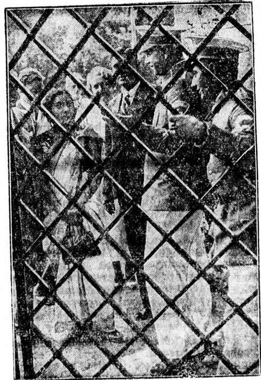
Asszonyoknak tilos a belépés.

Slogan, tipográfia, attrap, blikkfang, raszter. Micsoda új bábeli nyelv ez? Pedig nem modern tolvajnyelvről van szó, hanem mindennap hasz-nálatos reklám-szakkifejezésekről, amelyeket minden modern reklámozó kereskedőnek ismer-nie kell! Aki nem ismeri, meg kell tanulnia. Hogyan?... Olvasni kell a REKLAMÉLET-et. Ba-logh Sándor kitűnő reklámszaklapját, amely-nek új száma a szokásos nivós tartalommal, ren-geteg tippel, tanáccsal, szépen illusztrált kirakat-rovattal most jelent meg. Előfizetési ára egy év-re 400 lei. Kiadóhivatal: Budapest, V., Lipót kör-ut 9. szám.