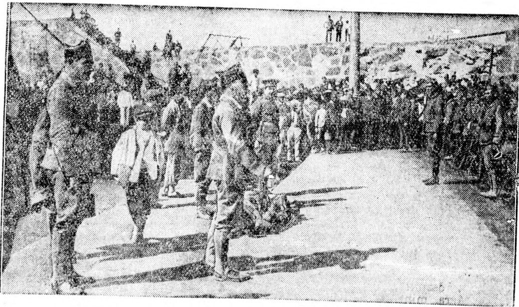
Első eredeti helyszíni felvétel a spanyol zendülésről.

Nagyon értékes a roueni múzeum, mely a lakatos- és kovács-művészet remekeit gyűjtötte össze a régi századokból. De Párizsban is sok olyan kis múzeum van, melyről a nagyvilág vagy a turisták tudomást sem vesznek. Ilyen a párizsi nagyopera zenei múzeuma, mely híres zeneszerzők eredeti kompozícióit állítja ki. A Trocadero közelében van egy másik érdemes múzeum, mely a világ összes világitótornyait mutatja be élethű modellekben.