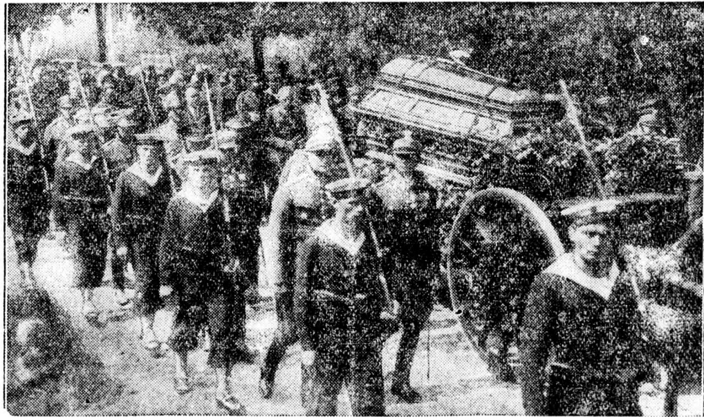
Orlicz-Dresszernek, a lengyel léghaderő főnökének temetése.

Mint hogy azonban a svéd gyárak jelenleg túl vannak halmozva másféle rendelésekkel, nem tudták teljes egészükben teljesíteni a litván rendeléseket. Ezért most másfelé fordul a szakkörök figyelmé és igyekeznek új szállítókat szerezni, mert a mezőgazdasági gépekben még belátható időn belül igen élénk keresletre lehet számítani.